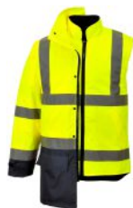
3 CASACO EXTERIOR COM CASACO INTERIOR SEM MANGAS