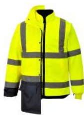
2 CASACO EXTERIOR COM CASACO INTERIOR