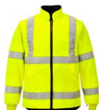
4 CASACO INTERIOR COM MANGAS