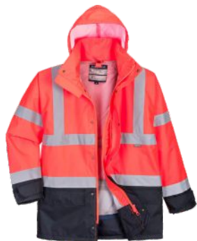
1 CASACO EXTERIOR